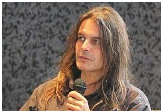
Jean-Marc Landry, éthologue suisse, auteur de plusieurs articles et ouvrages sur le loup.

Jean-Marc Landry souligne ainsi que « si le loup s'approche des habitations, ce n'est pas à l'homme qu'il s'intéresse. Les cas d'attaques sur les humains sont très rares. En revanche, quelques bergers ont rapporté que, lors d'une attaque de troupeaux en pleine journée, le loup leur aurait montré les dents lorsqu'ils se sont approchés pour essayer