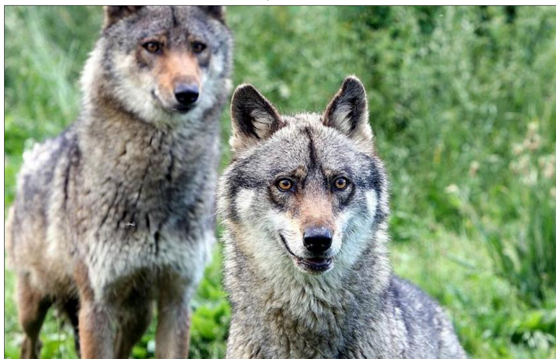
Quel est le comportement du loup face à l'homme ? Des scientifiques tentent de répondre à cette question.

« Le loup voit l'homme comme une menace, pas comme une proie »