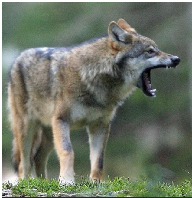
« En Italie, le loup n'a jamais disparu », précise Mattia Colombo.

Se basant sur des données de 2012, Mattia Colombo avance un nombre de « 14 meutes, avec un minimum de 50 individus, dans les Alpes italiennes occidentales, dans le Piémont ». »